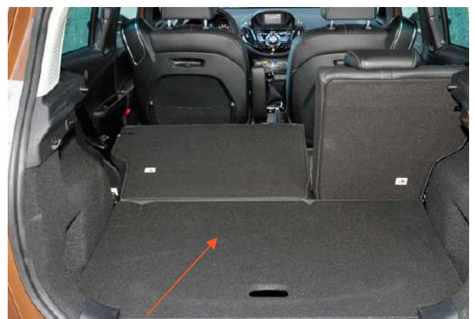
Doppelboden in höchster Position