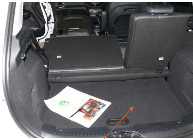
Doppelboden im Kofferraum in niedrigster Position